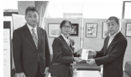
古河ヤクルト販売株式会社 様