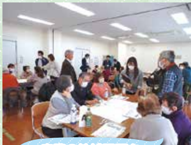
実際の地域課題を話し合いました

地域で生活する人のさまざまな課題(悩みや困りごと)とその課題を支援する過程で知っておきたい社会資源を知り、住民だけで解決するのではなく、関係機関や専門職などへのつなぎや連携と協働のあり方を学ぶものです。