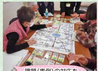
課題(事例)の対応を検討しました