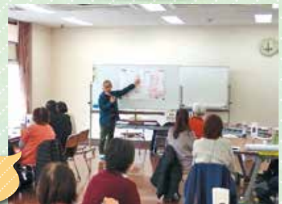
各グループの意見を全体で共有しました