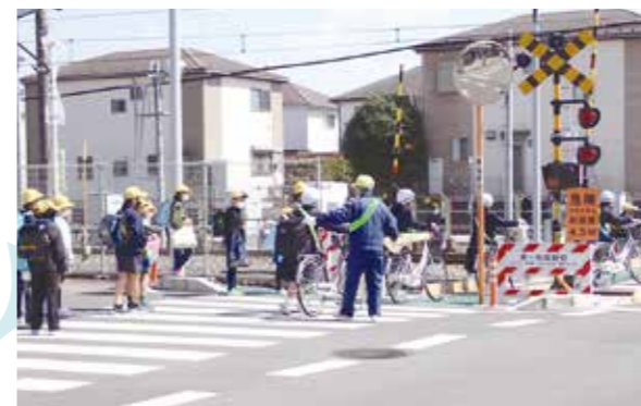
↑(子ども見守り隊の活動の様子)

3月24日、今日は小学校の終業式。午前11時30分、新橋小学校児童の下校時に、卯ノ木クラブの「子ども見守り隊員」は今日も児童の帰りを待っています。